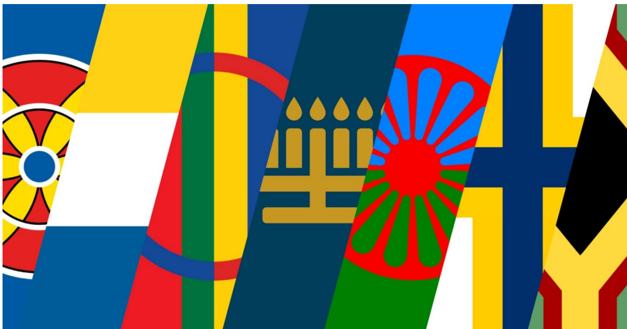
Symboler för de svenska minoriteterna.